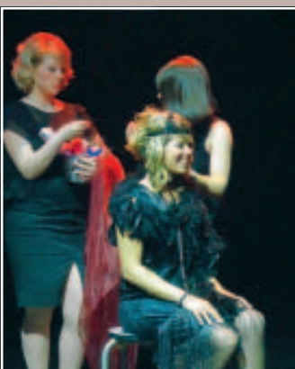
1 LES ANNÉES FOLLES COIFFURE EN DIRECT

J'aime beaucoup le style des années 20. C'est une époque où la femme commence à s'affirmer. Mais évidemment, c'est un avis très personnel.