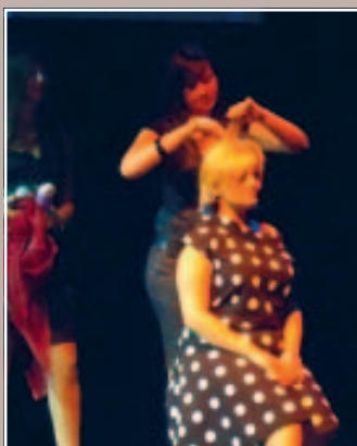
2 LES ANNÉES 60 COIFFURE EN DIRECT