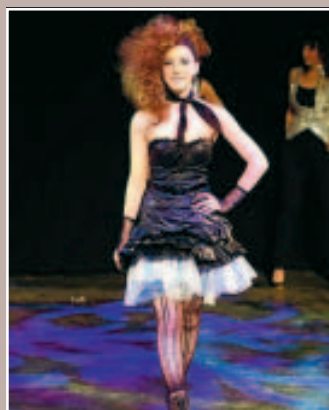
3 LES ANNÉES 80 LA FEMME OSE